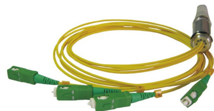
Peitschen mit Stecker