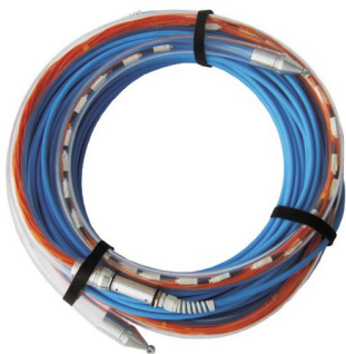
Fiber Quick als Bund

Für einen sicheren Transport und die sichere Verlegung werden die Enden mit einem Schutz versehen. Im Bedarfsfall kann auch eine Einziehhilfe montiert geliefert werden.