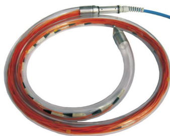
Kabelende mit Aufteiler und Peitschen in Einziehhilfe